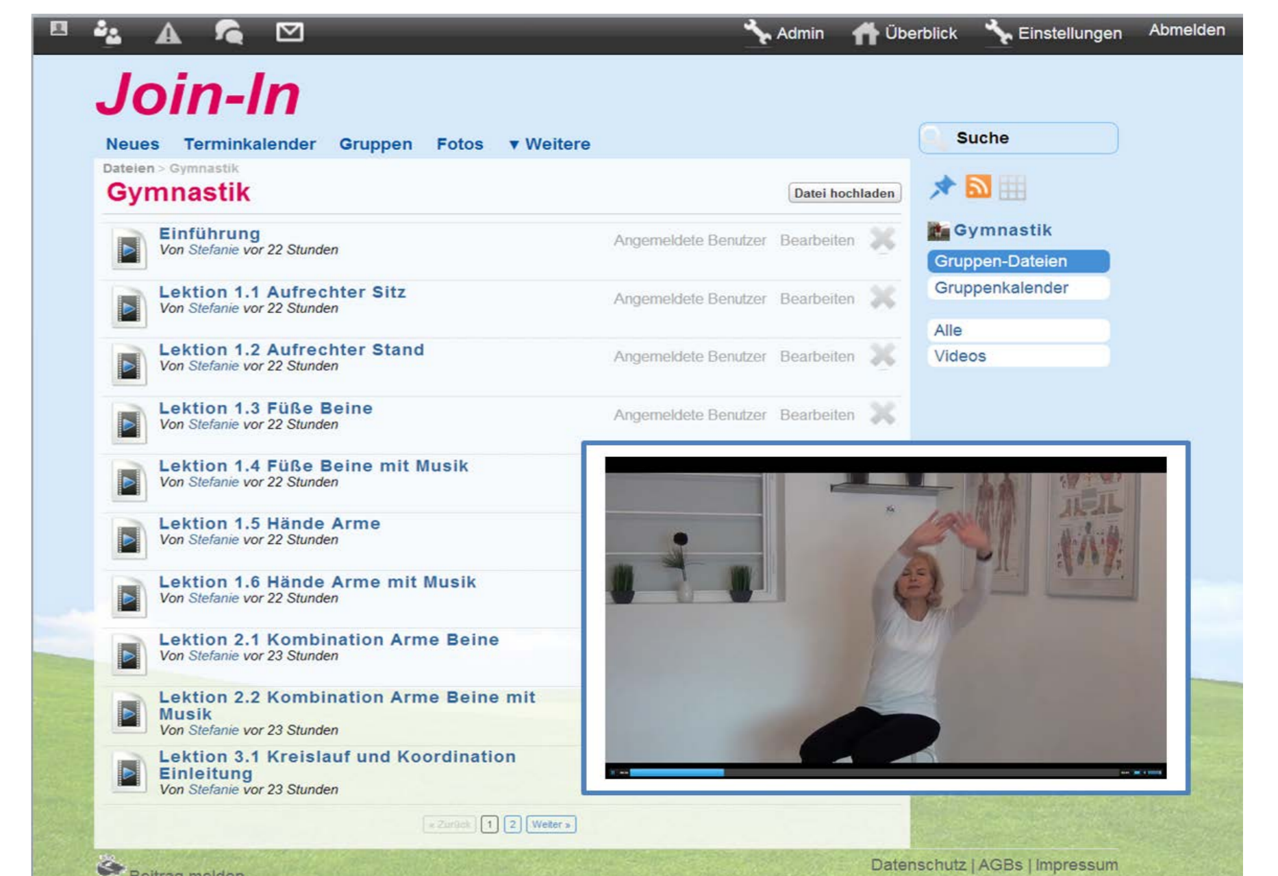
Bewegungsspiele und Gymnastik mit anderen machen Spaß und fördern die Gesundheit