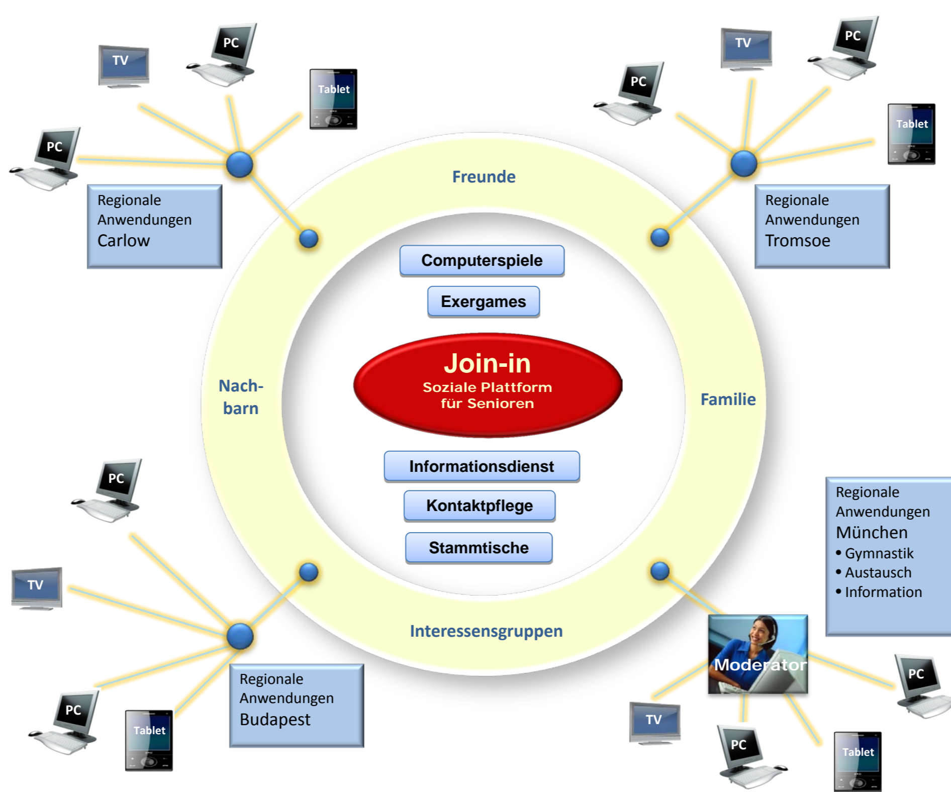
Überblick der Angebote und Benutzergruppen von Join-In

Die entwickelten Angebote basieren auf einer intensiven Nutzeranalyse von Senioren in Deutschland, Ungarn, Norwegen und Irland. Die Netzwerkplattform wurde mit der Open Source Social Networking Engine Elgg erstellt. Die Join-In Lösung integriert verschiedene Endgeräte: PCs mit und ohne Touchscreens, Settop-Boxen + Fernseher, und Tablets. Die Spiele sind browserbasiert. Die Videochat-Lösung basiert auf OpenTok. Die Bewegungen werden mit der MS Kinect Kamera aufgezeichnet. Hohe Nutzerfreundlichkeit, leichte Handhabung und ein attraktives Preis-Leistungs-Verhältnis stehen im Mittelpunkt der Entwicklungen.